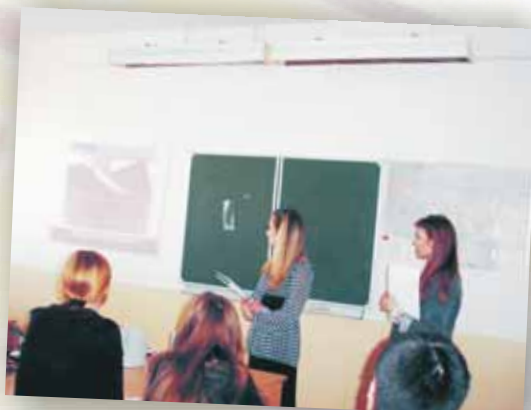
Одно из выступлений

Осталось много хороших воспоминаний и эмоций. Это был хороший опыт для всех нас. Надеюсь, что такая же конструктивная и интересная работа клуба продолжится и в следующем году. С нетерпением ждем это поры. Думаю, что наша работа заинтересует многих студентов, ведь все мы студенты факультета международных отношений, и иностранный язык – это наше все!