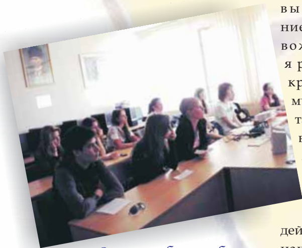
Во время работы клуба

Вместе с учебным годом подошла к своему логическому завершению работа нашего лингвострановедческого клуба « Britain and America in Focus », в котором принимали участие студенты 1 и 2 курса специальности «Международные отношения». Студенты 1 курса представляли Великобританию, а студенты 2 курса – Соединенные Штаты Америки.